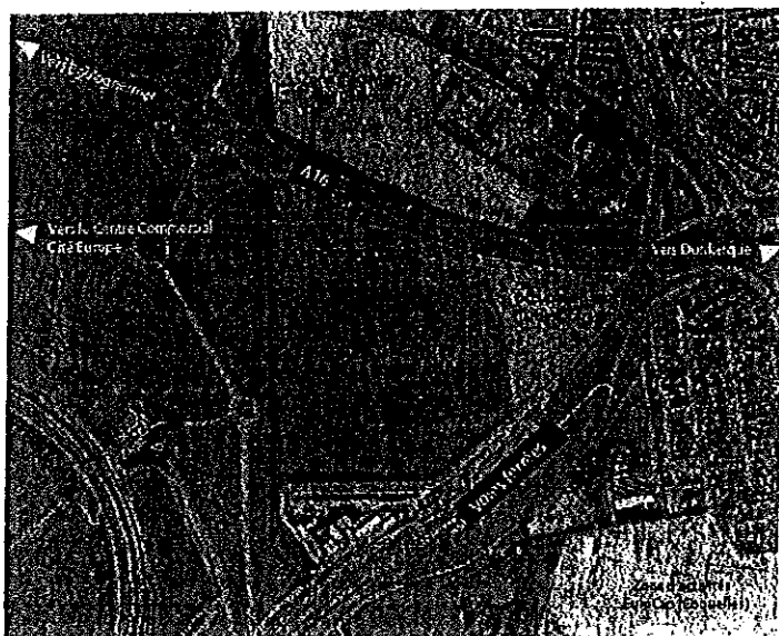
ZONE D'ACTIVITES DE LA RIVIERE NEUVE - PLAN DE SITUATION

Le projet consiste en la création de la ZAC Rivière Neuve à Calais, sur une superficie d'environ 17,65 ha à proximité du terminal transmanche Eurotunnel et des infrastructures routières (A16 et RD 304) et ferroviaires. Cette ZAC doit permettre l'implantation d'activités commerciales, artisanales, tertiaires, industrielles et d'entrepôts sur des parcelles de 2 000 m 2 à 20 100 m 2 et de nouvelles entreprises créatrices d'emplois.